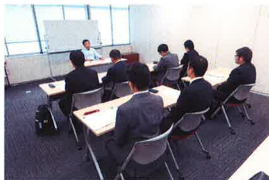
新任管理者教育の受講風景

安全最優先の職場風土の確立と現場の安全マネジメント強化には管理者の役割が重要なため、現場管理者を対象に「管理者としての知識、法令、安全・事故防止」に主眼を置いて、新任管理者教育を実施しています。