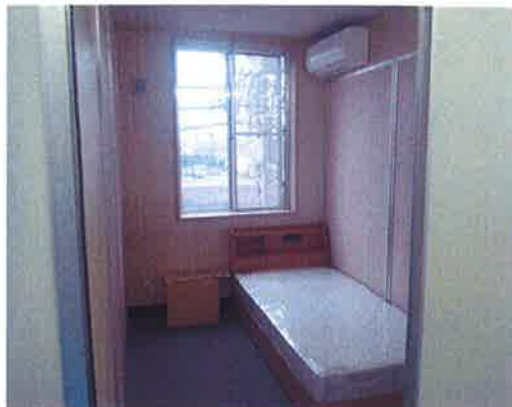
改装後の個室、ベットは木製の物に変更し、エアコンも部屋ごとに装備