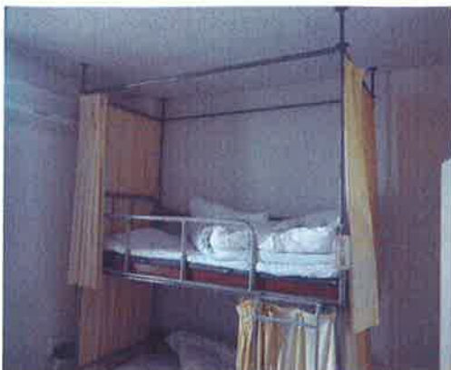
旧の二段式鉄パイプベット一部屋に2台セットされて、4人で使用していた。

働きやすい職場環境を整え、事故防止と労働災害防止を目的に5S（整理、整頓、清潔、清掃、躰）の一環として、川崎貨物駅 輸送本部のレイアウトを大幅に見直し、休養室を4人で一部屋使用から完全個室化しました。