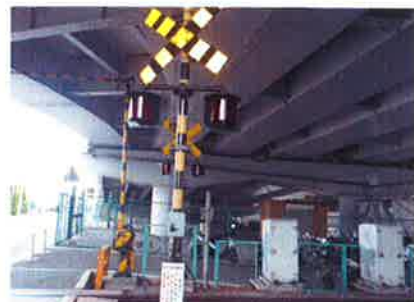
※踏切警報灯を視認性の高い全方向形に交換