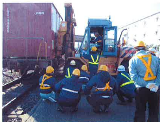
貨車を持ち上げた状態で、貨車の故障箇所等の説明を受けているオペレーターの訓練風景