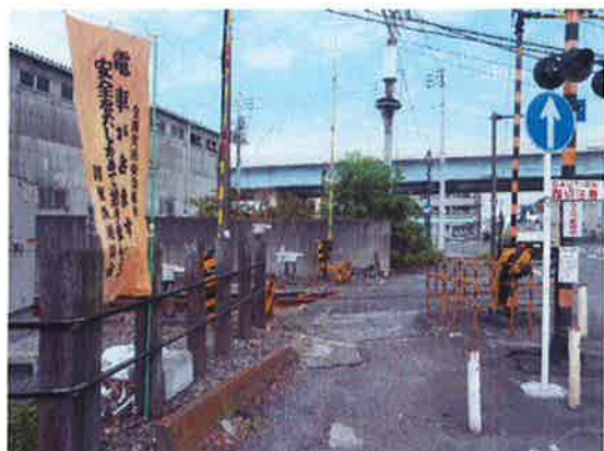
*地域の皆様への注意喚起のノボリ

※おねがい：踏切道の安全を確保するため、踏切設備の故障や異常に気づかれたときは、連絡先にお電話くださるようお願いする内容で看板を掲出しています。