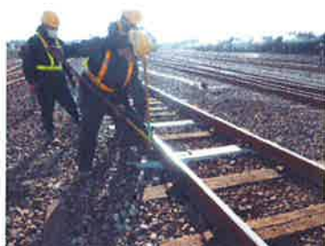
※木製枕木からPC(コンクリート)枕木への交換作業

軌道強化のため木マクラギからPCマクラギに順次交換(平成29年度1,039本)しています。また、保安設備、踏切の警報灯をより見易くするため全方向形に交換し、信頼度の向上を図り安全確保に努めた他、防犯・災害・テロ対策を目的とした高感度・監視カメラを10台から11台に増設しました。入換に使用している構内入換用無線機の約半数(35台)を高機能の無線機に更新し、良好な無線通信を行うなど、輸送の安全体制に万全を期しています。