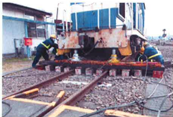
脱線した機関車をジャッキで持ち上げて横移動させてレール上に載線させる訓練風景

当社では、鉄道輸送や地域の皆様の安全に役立つような異常時訓練を実施しています。平成29年度も、車両が脱線したことを想定し、塩浜機関区で機関車脱線復旧訓練【平成29年12月15日実施】川崎車両事業所貨車派出と神奈川臨海通運が合同で、フォークリフトの車体（貨車）吊り上げ防止訓練【平成29年12月23日実施】を実施しました。これはフォークリフト作業員全員を対象に実物の車両（貨車）とコンテナを使用し、フォークリフトによる持ち上げを体感するとともに、机上教育により吊り上げが重大事故につながる可能性について教育・訓練を行いました。