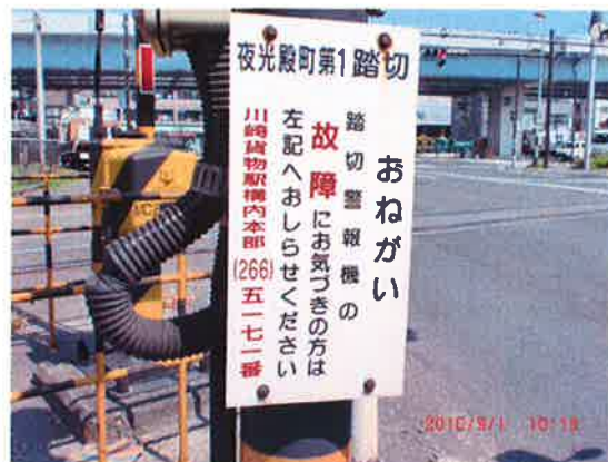
*踏切のおねがい看板